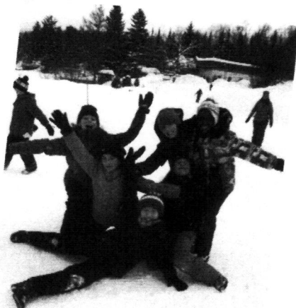
Classe neige des 5 e année