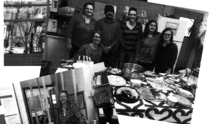
Merci aux parents et aux bénévoles!