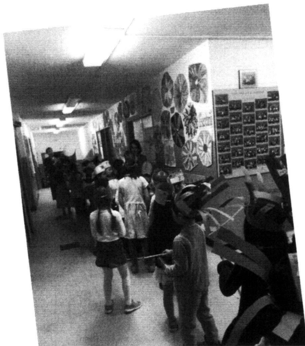
Parade des 100 jours des maternelles